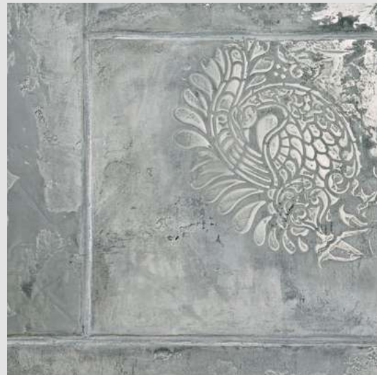
METALLO_FUSO & ARCHI+ CONCRETE