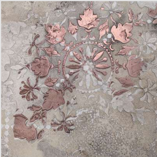
METALLO_FUSO & CALCECRUDA

Metallo_Fuso confère une élégance rare à tous les environnements. Sa combinaison avec un produit comme CalceCruda produit des effets raffinés qui embellissent les espaces.